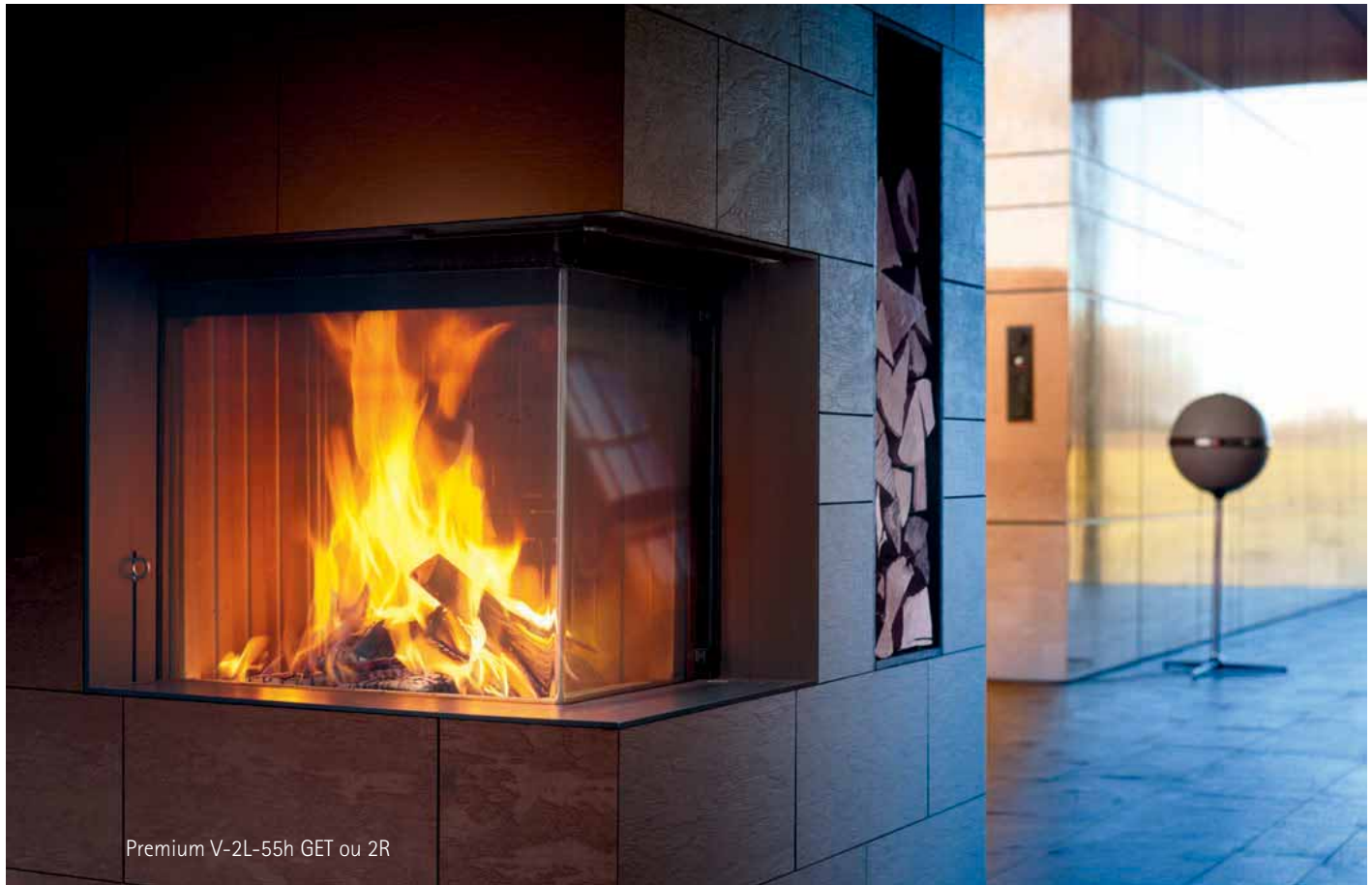
Premium V-2L-55h GET ou 2R