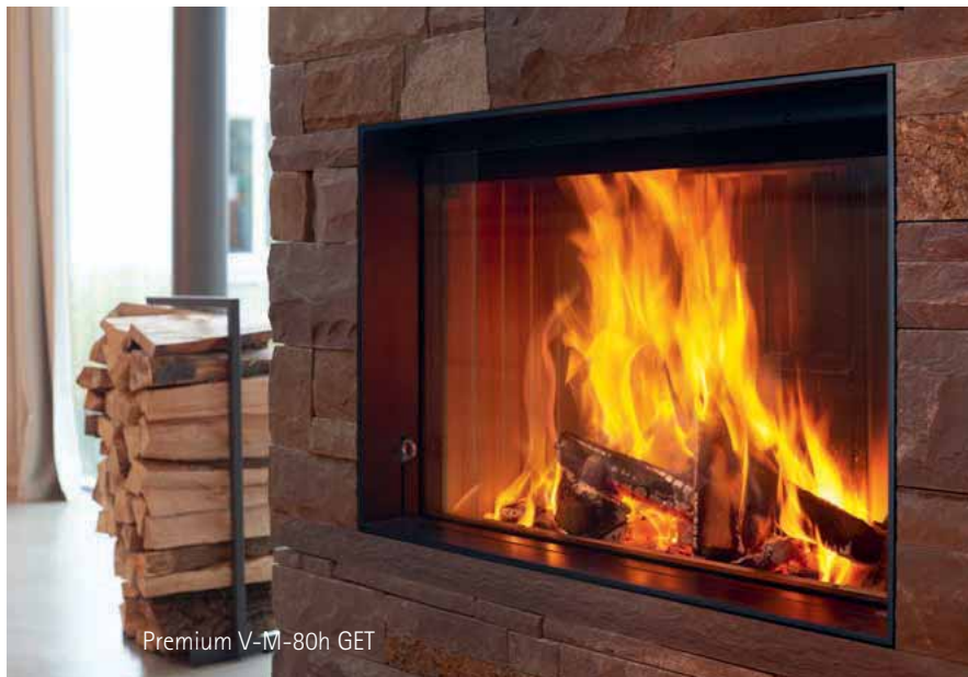
Premium V-M-80h GET