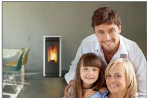
Souape de sécurité