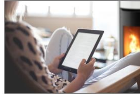
Conçu pour le Confort acoustique