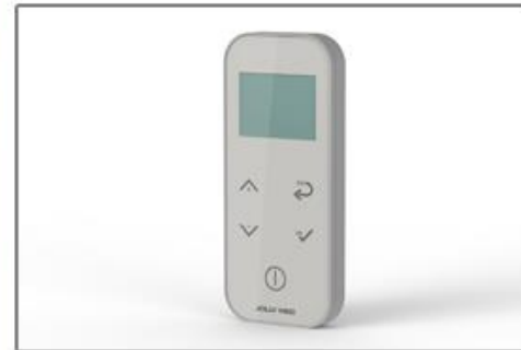
Radiocommande RF tactile