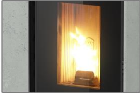
Ample vision de la flamme