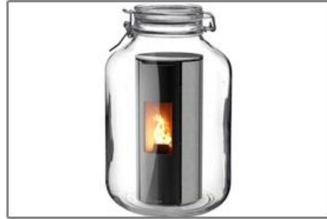
Ne prélève pas l'air ambiant