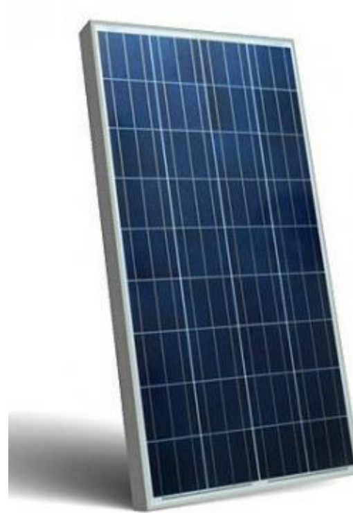
Dimension panneau: 1 x 2 m